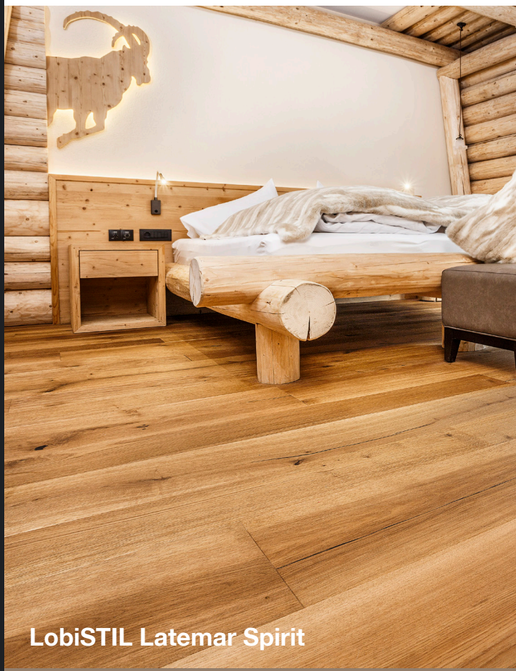
LobiSTIL Latemar Spirit