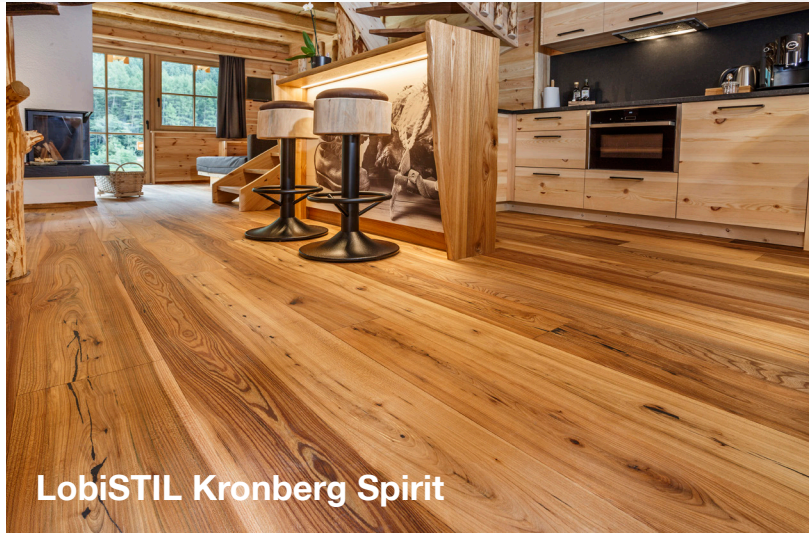
LobiSTIL Kronberg Spirit

Verschiedenste Holzarten, Farb-Kombinationen und Oberflächenbehandlungen sind möglich, weshalb wir auf der Preisliste nur einige Varianten anführen können. Mit LobiSTIL sind der Fantasie keine Grenzen gesetzt. Gerne können wir gemeinsam Ihren Traumboden konfigurieren.