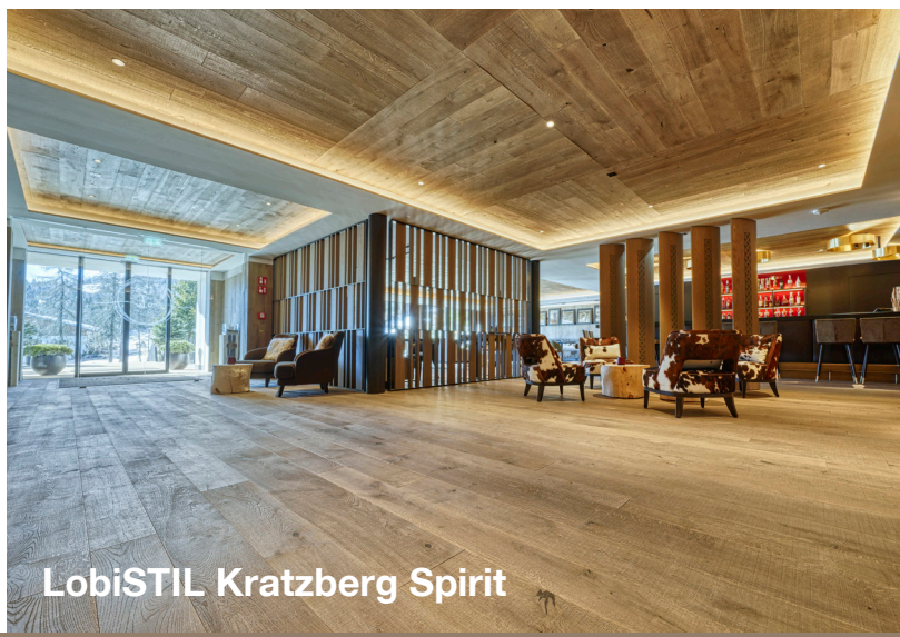
LobiSTIL Kratzberg Spirit