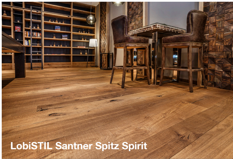
LobiSTIL Santner Spitz Spirit